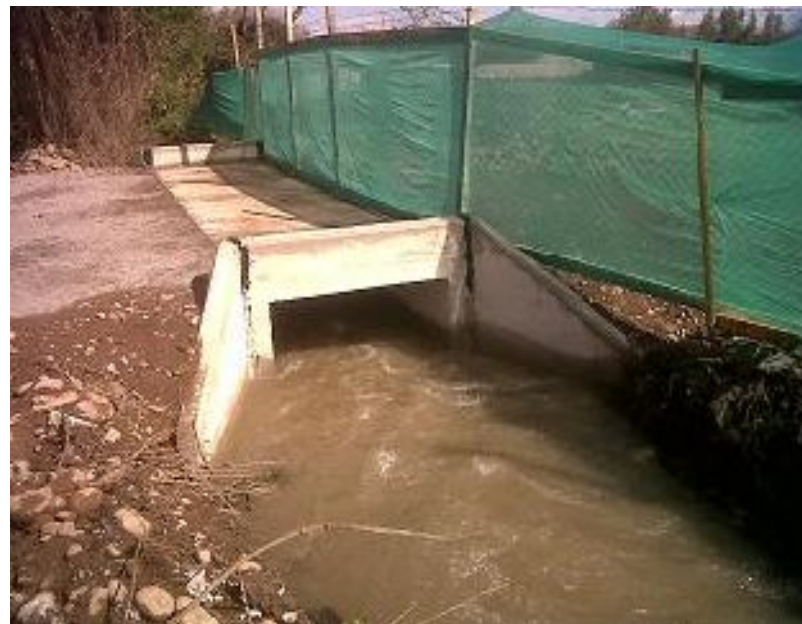
Foto 3 y 4: construcción de Acceso vehicular en empresa Macrofood. San Bernardo.