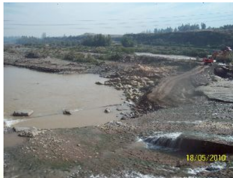
Reparación losa Bocatoma El Clarillo.