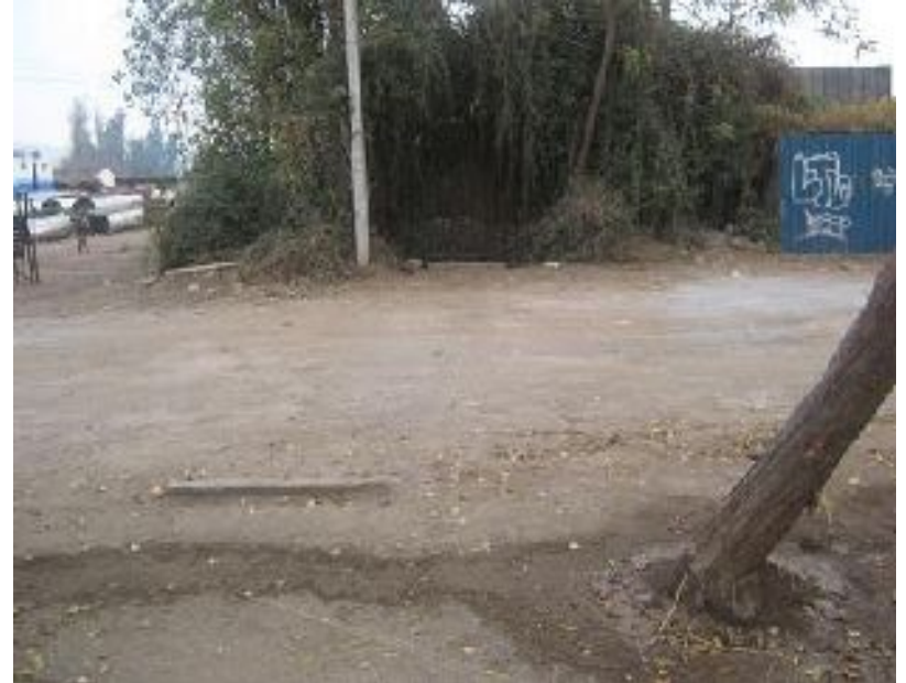
Fotos 5 y 6: antes y después de construcción de entubamiento en Arturo Gordon. San Bernardo . Convenio MOP – Autopista Central – Asoc. Canales de Maipo.