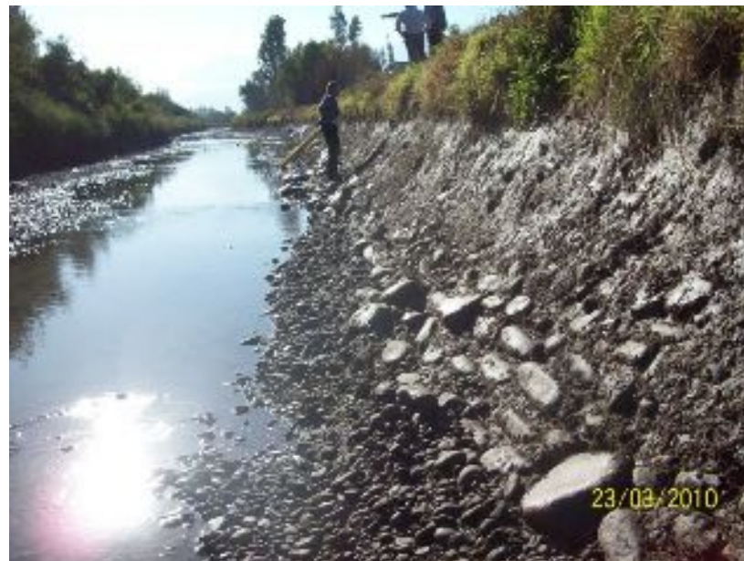
Inspección dentro del Canal Tronco.