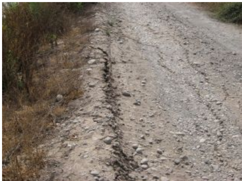
Grietas borde Canal Tronco después de Terremoto.