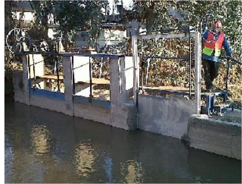
Foto 11 y 12: Compra e instalación de compuerta galvanizada en descarga de canal Espejo a Santa Marta. Maipú.