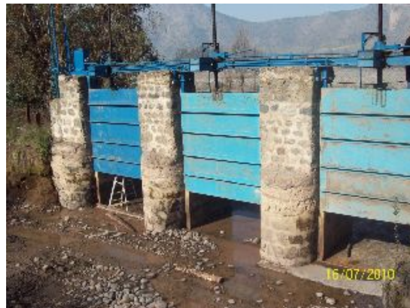
Reemplazo compuertas Canal Tronco de descarga a Río Maipo.