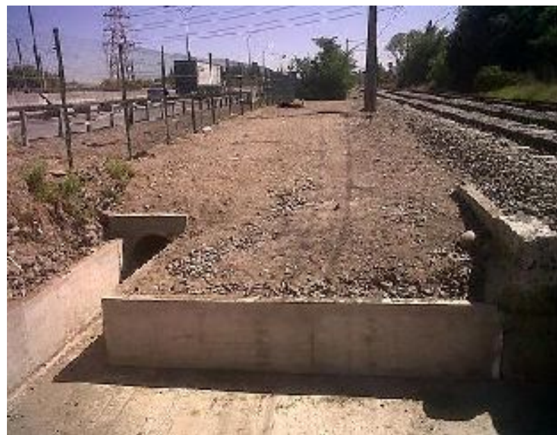
Fotos 9 y 10: antes y después de la construcción de canal de desagüe en Jardín Italiano. San Bernardo. Convenio MOP – Autopista Central – Asoc. Canales de Maipo.