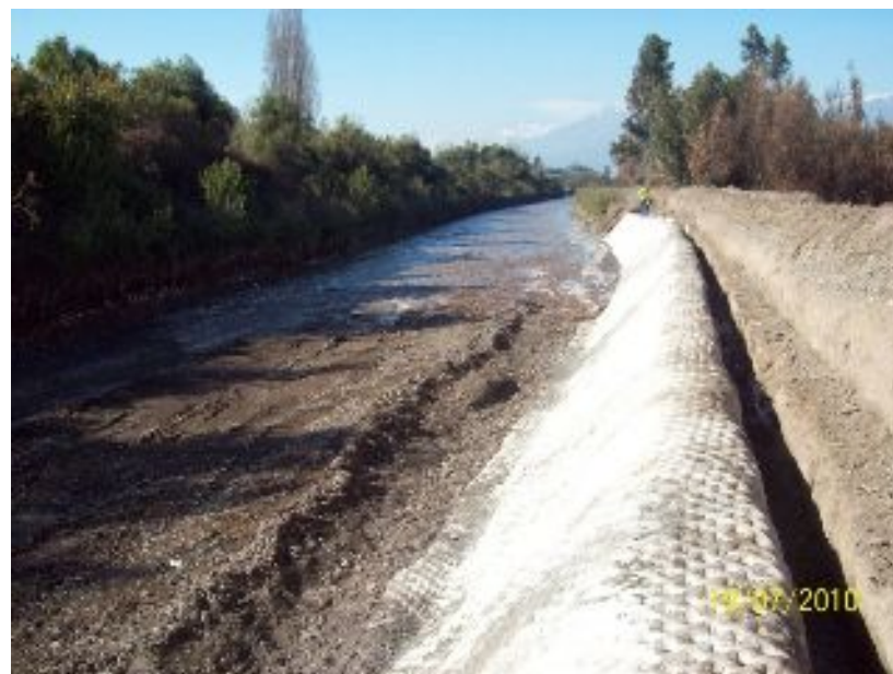
Inicio flujo de agua en Canal Tronco.