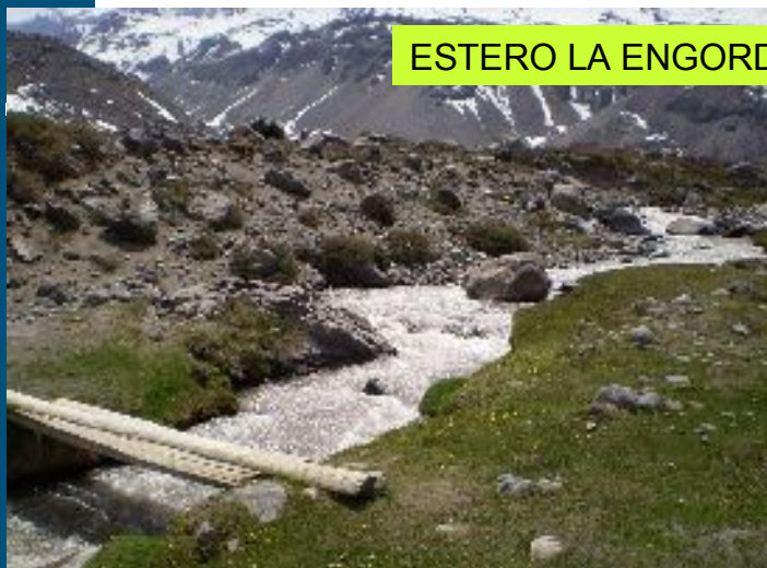
ESTERO LA ENGORDA