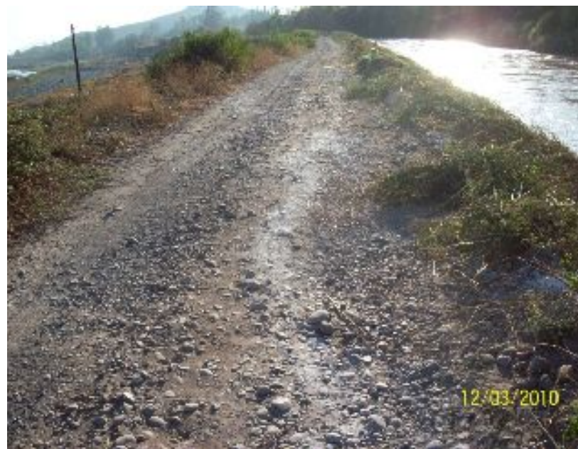
Grietas en camino costado Canal Tronco.