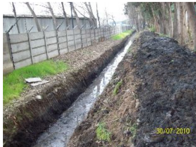
Canal El Bajo, sector Las Margaritas, Comuna de San Bernardo.