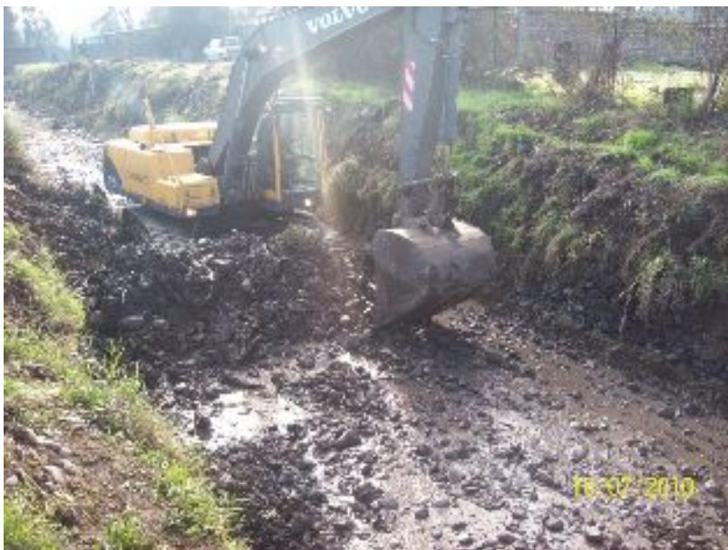
Canal Espejo, sector Calle Costanera, Comuna de San Bernardo.