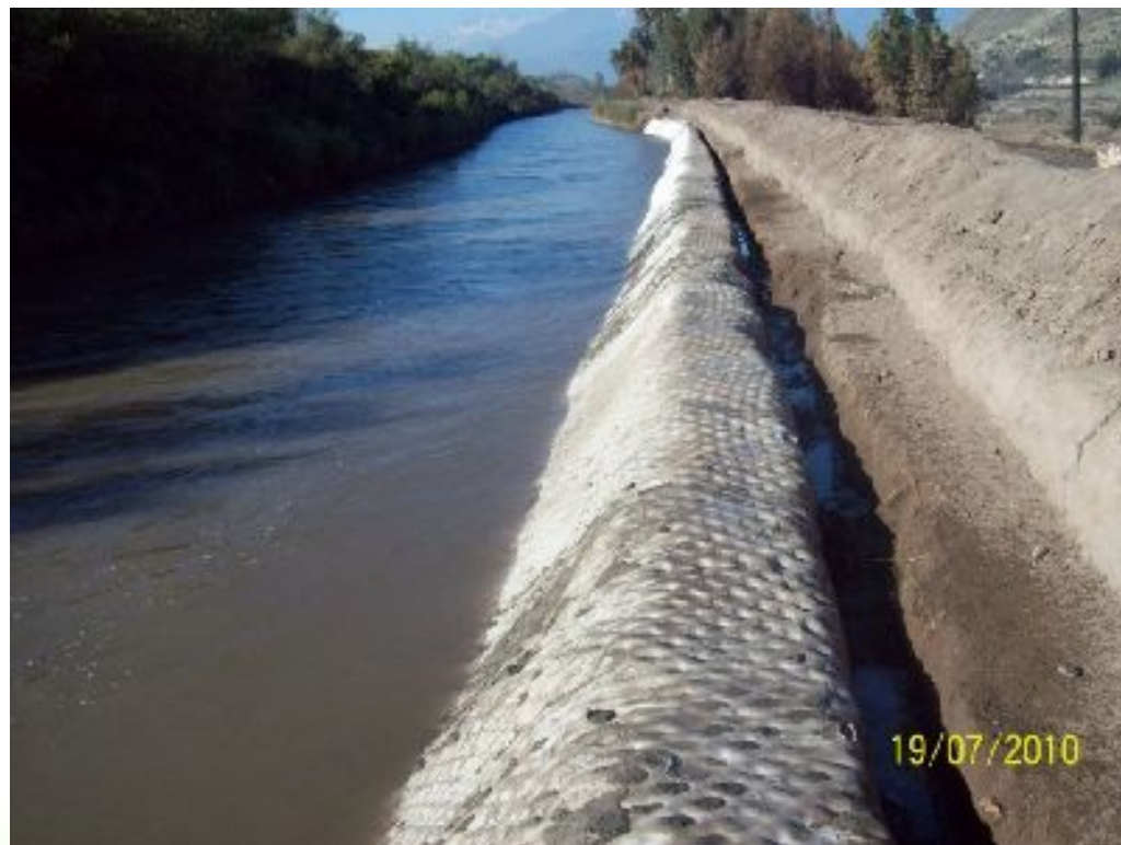
Canal Tronco en funcionamiento.