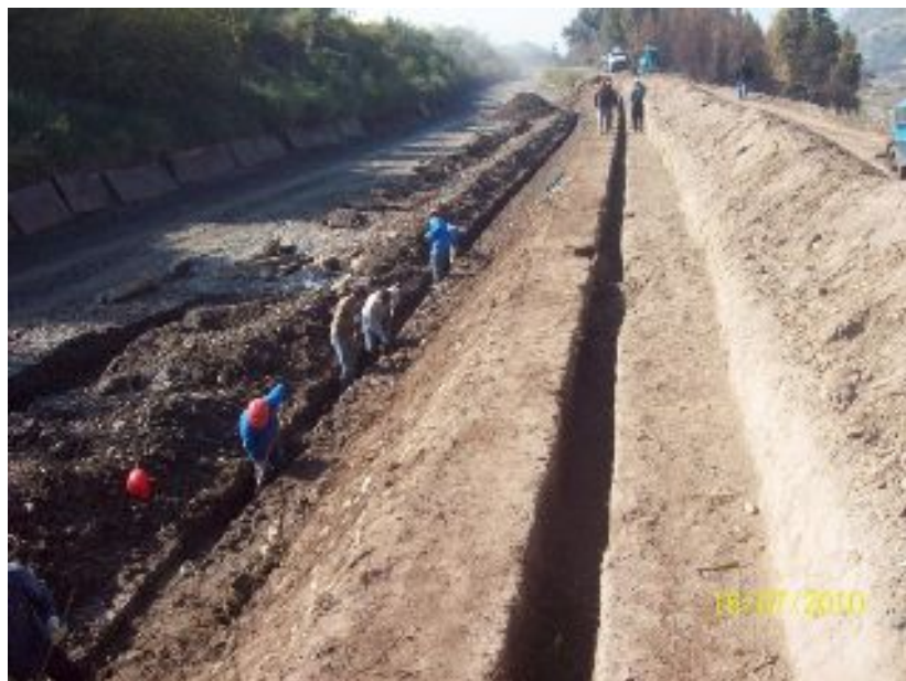
Excavación y preparación del terreno.