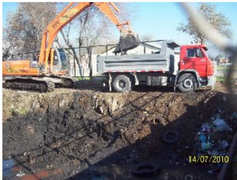
Canal Espejo, sector calle Yungay, Comuna de San Bernardo.