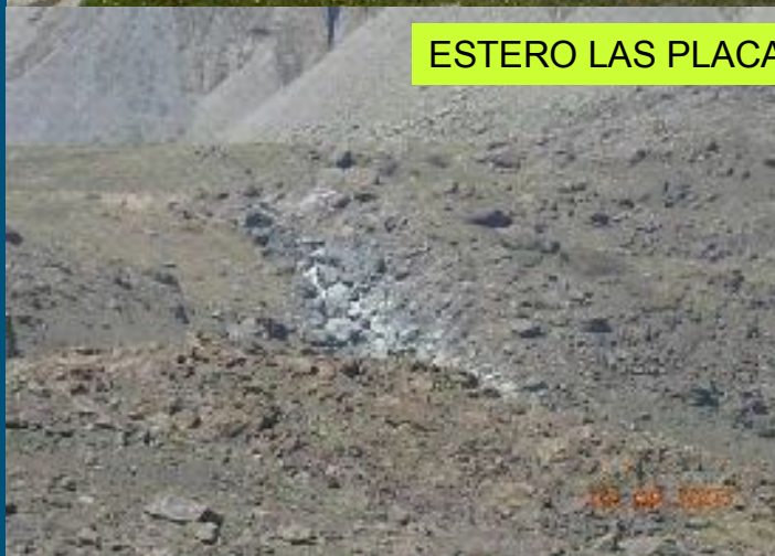
ESTERO LAS PLACAS