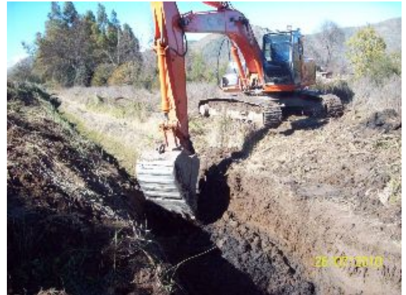
Canal Capilla Santa Cruz, sector San León, Comuna de San Bernardo.