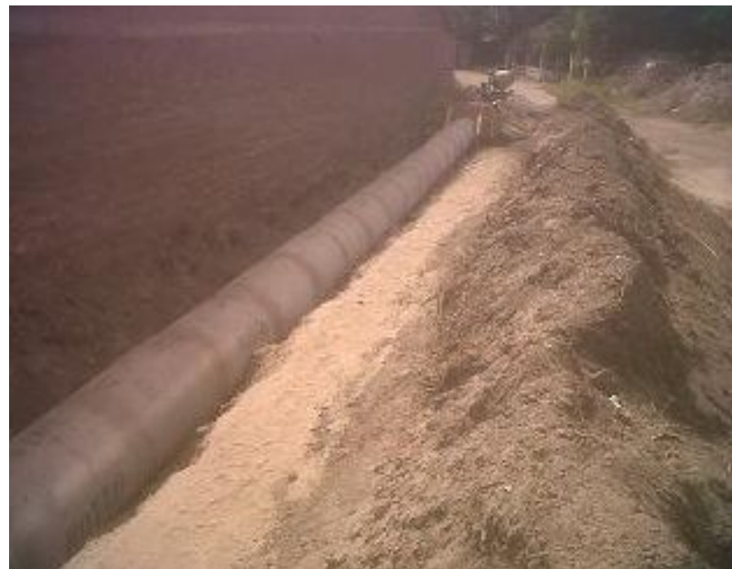
Foto 7 y 8: Rehabilitación canal de riego Mall Plaza Sur. San Bernardo.