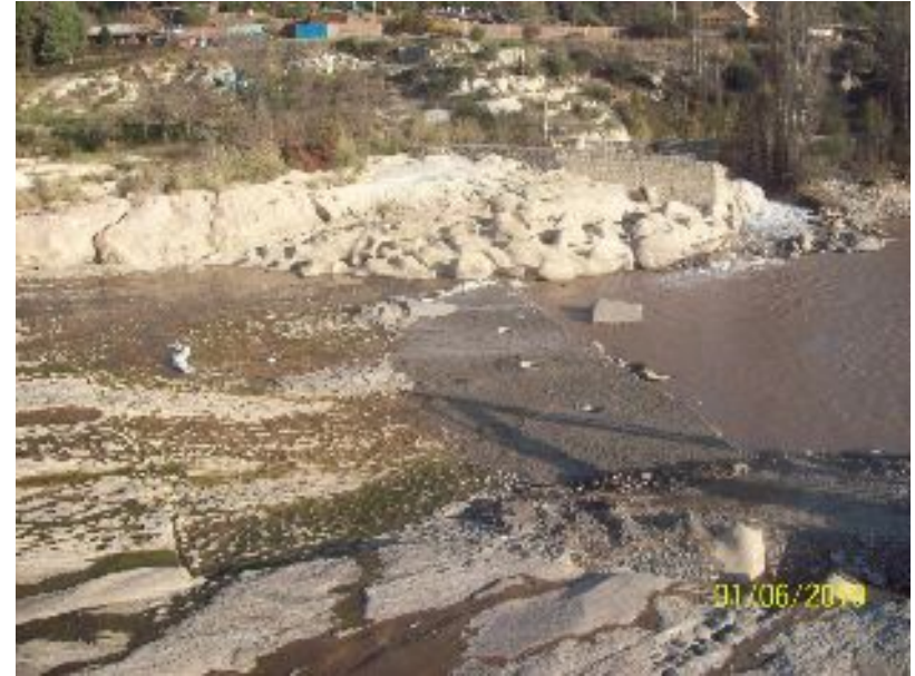
Reparación losa Bocatoma El Clarillo.