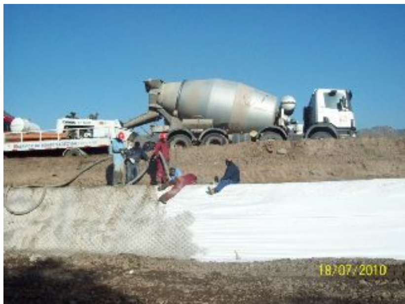
Llenado con mortero del Filter Point Matt.