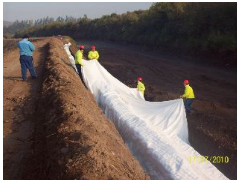
Instalación del Filter Point Matt.