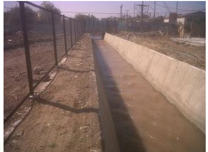
Foto1 y 2: Antes y después del revestimiento del canal Santa Cruz. Comuna Padre Hurtado.