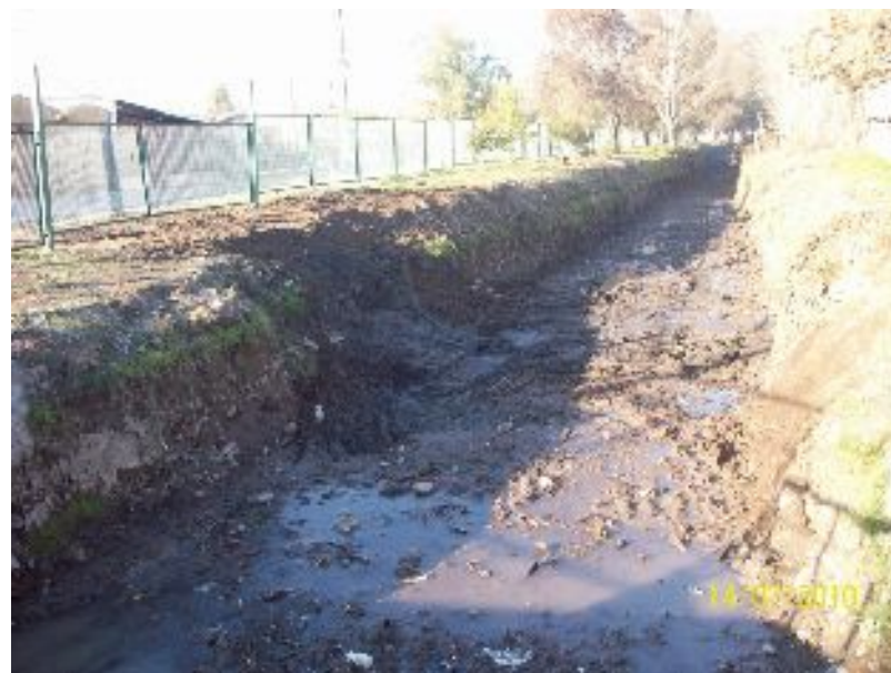
Canal Espejo, sector Calle Balmaceda, Comuna de San Bernardo.