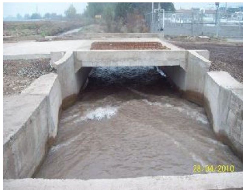
Foto 13 y 14: construcción de puentes sobre canales Espejo y Ramal Santa Ana. Loteo Industrial Jardín del Sur. San Bernardo.