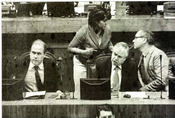
El ministro de Agricultura, Carlos Furche, y su par de Obras Públicas, Alberto Undurraga, presenciaron la discusión del proyecto de ley y su posterior aprobación, que se extendió por más de cuatro horas en la Cámara Baja.