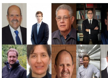
"Juntos x el Agua": el grupo de expertos hídricos que entrega propuestas para la nueva Constitución