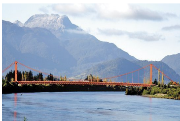
Tras 14 años, nuevamente el MOP establece un decreto de escasez hídrica para las comunas de Aysén