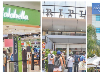
Cencosud, Falabella y Ripley eliminan casi 32 mil puestos de trabajo en América Latina en cinco años