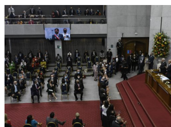
Boric apunta a equipo de protocolo por ausencia de empresarios en cambio de mando: "No ha habido un ánimo de exclusión"