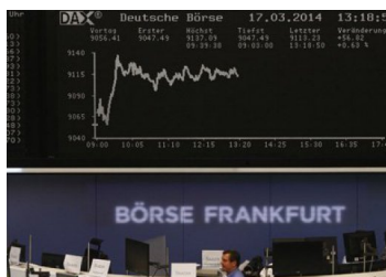
Bolsas europeas repuntan en jornada marcada por conversaciones entre Rusia y Ucrania